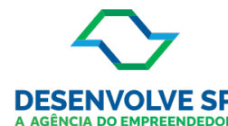
Agência de Fomento do Estado de São Paulo