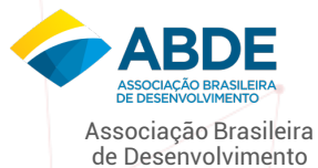
Associação Brasileira de Desenvolvimento