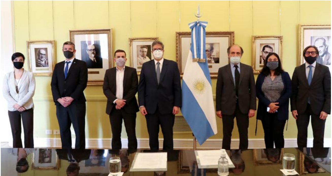
Acuerdo entre BNA y CAF para promover inclusión financiera de población vulnerable en Argentina.

En esta etapa difícil que nos toca vivir necesitamos hacer el máximo esfuerzo y aportar soluciones creativas para armar instrumentos financieros acorde con la necesidad de los distintos sectores y empresas y, así, poder avanzar.