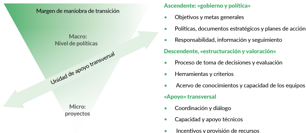
Figura n.º 1: Proceso de toma de decisiones e impacto de la información relacionada con el cambio climático