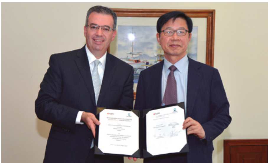
Firma de convenio entre Bancomext y K-SURE (2016).

Cabe hacer notar que de los tres primeros receptores de AOD en 2013, Colombia y Perú negociaron tratados de libre comercio. En