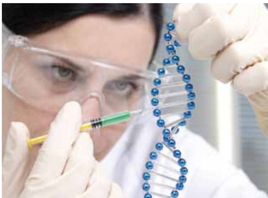
El uso de nuevas tecnologías es uno de los objetivos del programa de Corfo.

Su objetivo es fortalecer la relación público-privada de InnovaChile, para abordar desafíos y oportunidades de negocios nacionales e internacionales. De esta Subdirección depende la Unidad de Programas de Innovación.