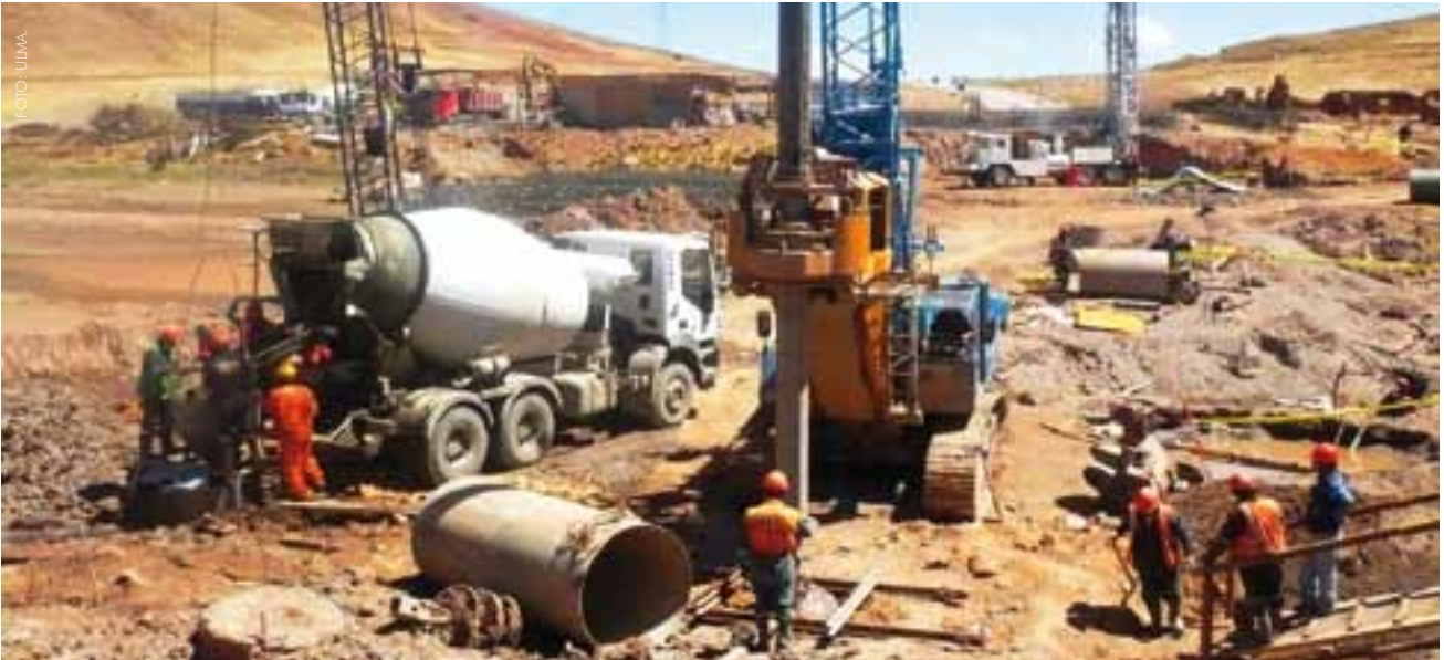
Mejorar la infraestructura de la región permite que los sectores más alejados se integren al mercado con celeridad.

asume las auditorías externas independientes y las evaluaciones realizadas.