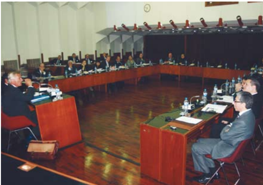
El seminario donde SEK mostró los detalles del sistema de exportaciones sueco se desarrolló en la sede de ALIDE, en Lima.

SEK, por su parte, tiene una calificación muy alta (rating S&P, AA+ y Moody's, Aa1), a pesar del escenario económico mundial. La agencia está especializada en el mercado de capitales internacional de donde obtiene los fondos para sus operaciones mediante préstamos de largo plazo.