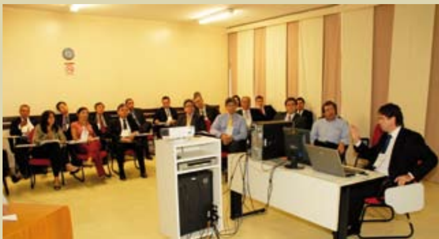
Comité Técnico de Infraestructura durante la Asamblea de ALIDE.

El programa también ha contribuido a la profundización del mercado de crédito para infraestructura local al haber acreditado por primera vez a 225 municipios